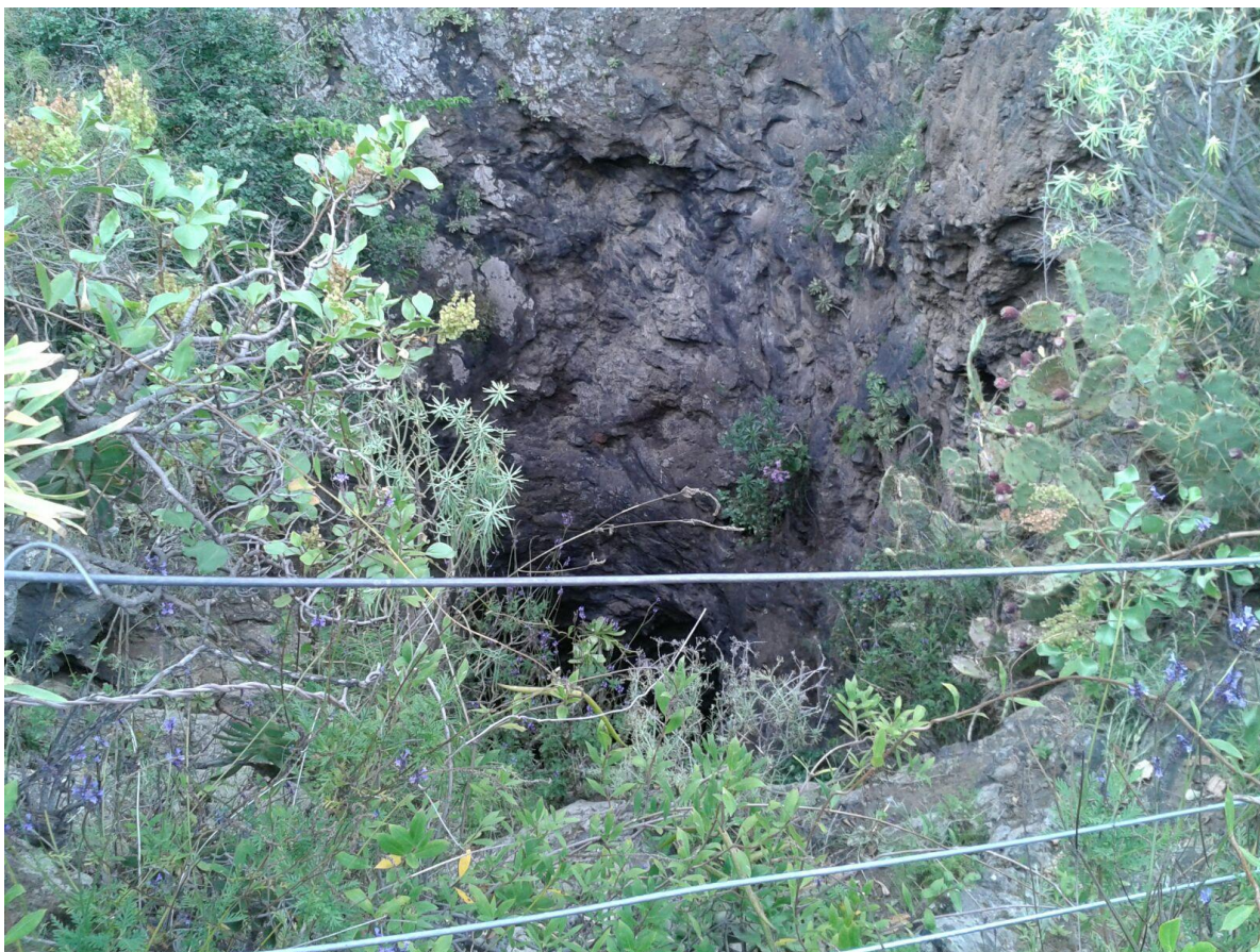
Sima del Jinámar