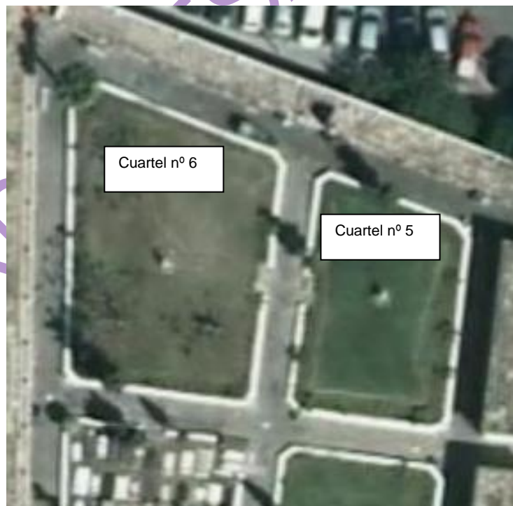
SicPag de Canarias - ampliación del cuartel n6 y nº 5