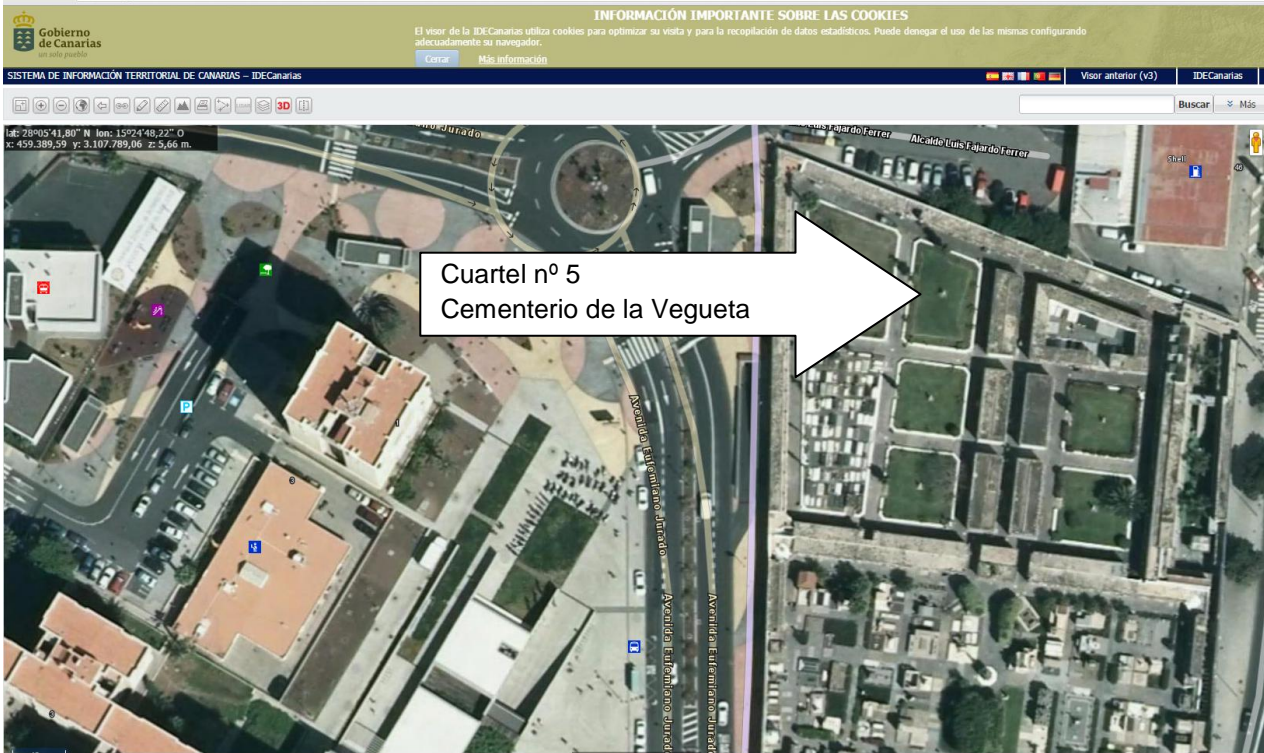
SicPag de Canarias - Cementerio de la Vegueta - las Palmas de Gran Canaria