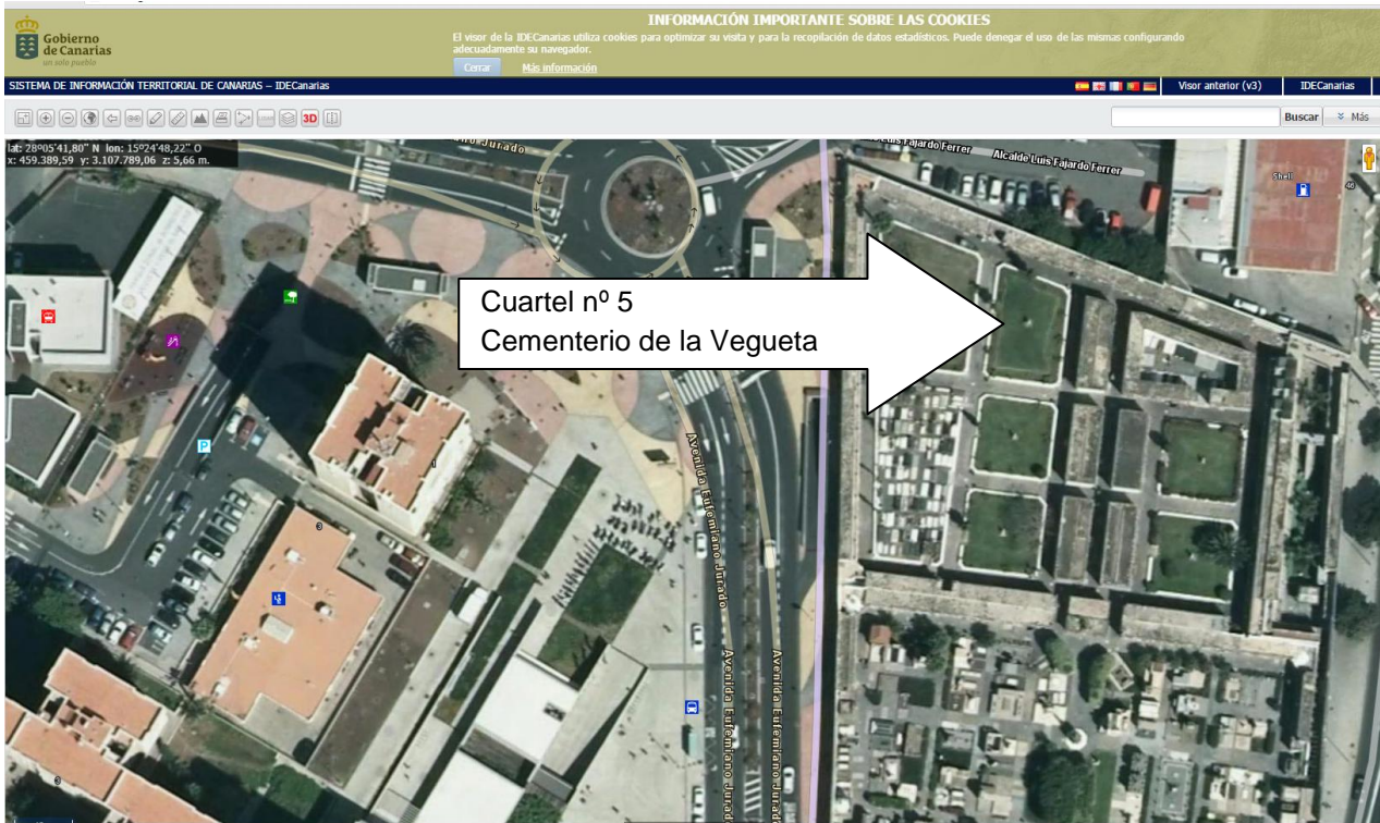
SicPag de Canarias - Cementerio de la Vegueta - las Palmas de Gran Canaria