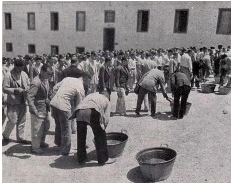
Prisioneros republicanos en el Campo de Concentración de Gando 2