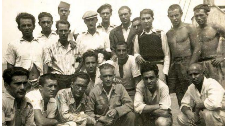
Prisioneros republicanos en el Campo de Concentración de Gando 1