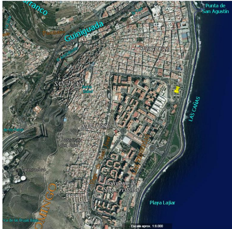
Mapa de ubicación nº 3

Web: ardfdesaparecidos.com - Tlfno: 605 87 79 31