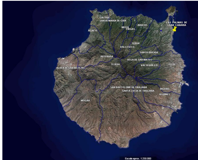
Mapa de ubicación nº 1