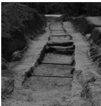
Fosa común múltiple dividida en cuartelillos - cuarteles o fosillas

.- Exhumación de la fosa común múltiple denominada cuartelillas, cuarteles o fosillas, que se ubica en el Cementerio de Las Palmas 35016 LAS PALMAS DE GRAN CANARIA Plaza Alcalde Alejandro del Castillo, 2, también conocido como La Vegeta (por las cercanías que mantuvo con una Colonia del mismo nombre del cual lo tomó).