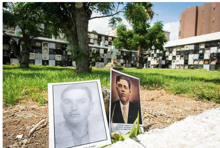
Fotografías de dos de los desaparecidos en la posible fosa común