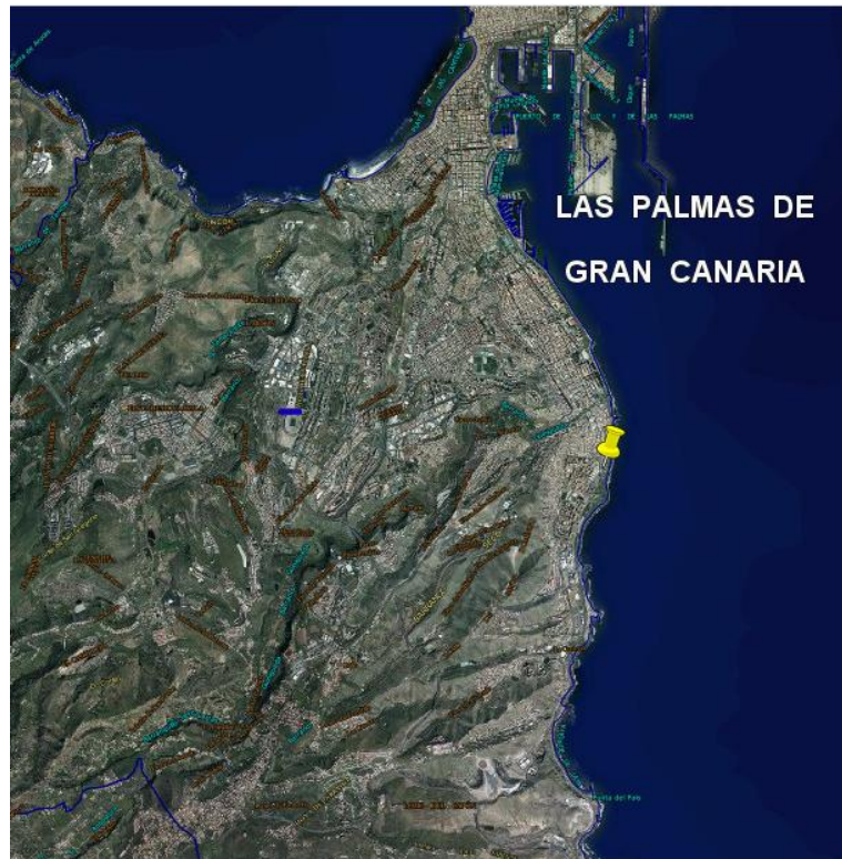
Mapa de ubicación nº 2