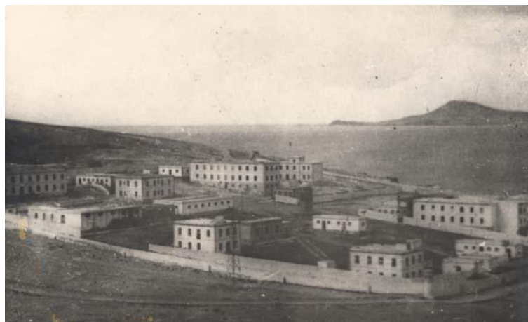
Antiguo Lazareto de Gando reconvertido por los fascistas sublevados en un Campo de Concentración 3