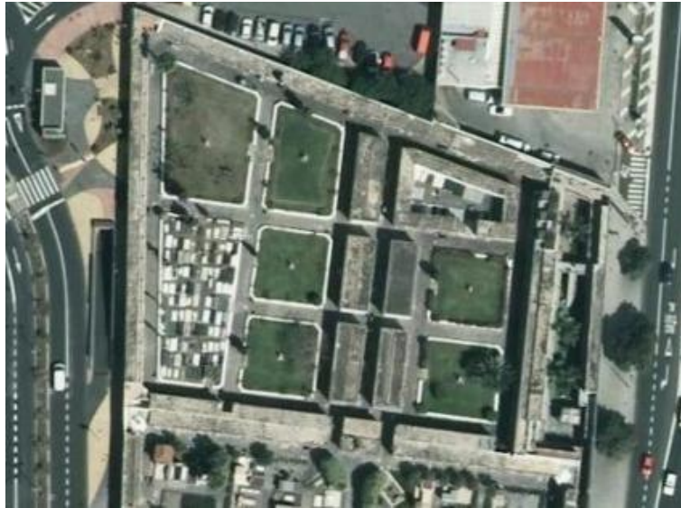
Mapa de ubicación nº 5

Web: ardfdesaparecidos.com - Tlfno: 605 87 79 31